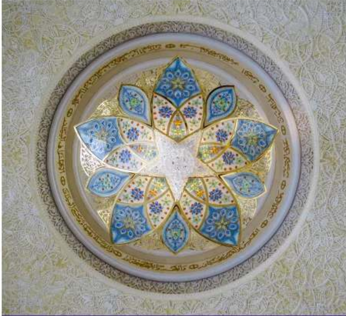
مستوحى من جامع الشيخ زايد الكبير، أبوظبي

تصميم يعكس مفاهيم الثقافة المحلية والمجتمع المعاصر والمواطنة العالمية