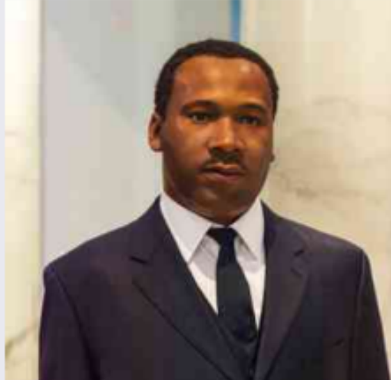
مارتن لوثر كنج

هل يمكنك التفكير في أي أشخاص مشهورين عارضوا التمييز والتحيز؟ ستتعرف الآن أحد أشهر المتحدثين عن التسامح: مارتن لوثر كنج.