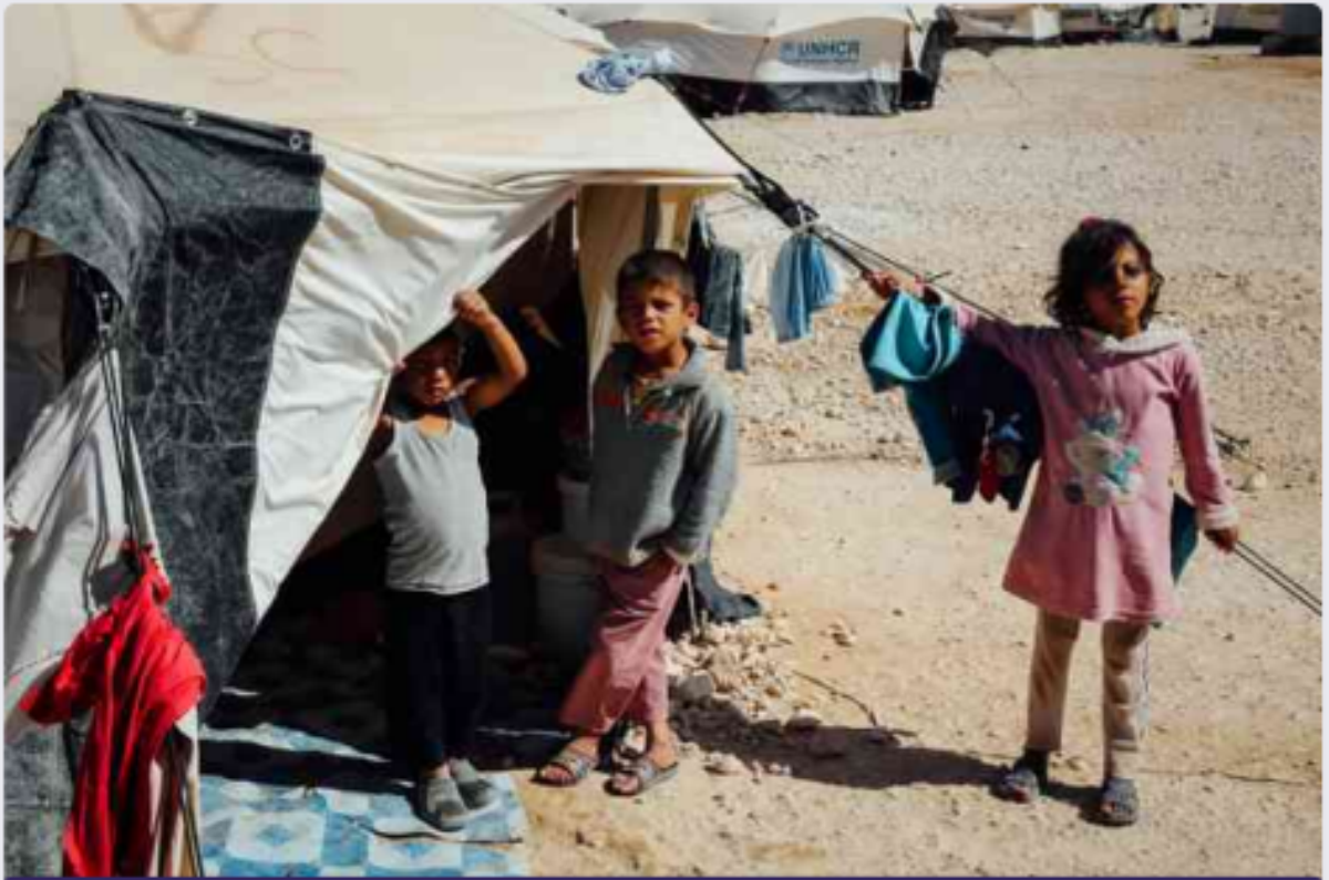
محيّم المفرق للاجئين