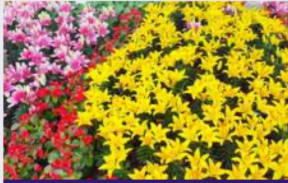
مجموعة متنوعة من الزهور