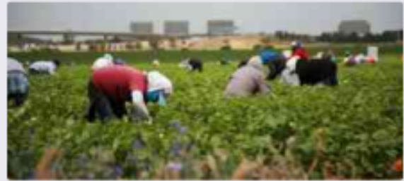
الفئة المجتمعية والعلاقات بين أفرادها: