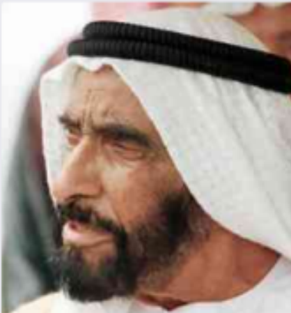
الشيخ زايد بن سلطان آل نهيان - رحمه الله، رئيس الدولة وحاكم إمارة أبوظبي سابقاً ومؤسس دولة الإمارات العربية المتحدة (1918-2004)

1 تعرّفنا في الدرس السابق مفهوم التماسك الاجتماعي. اقرأ مقولة الشيخ زايد بن سلطان آل نهيان - رحمه الله - ثم ناقش أهمية الإنسان في المجتمع وتماسكه.