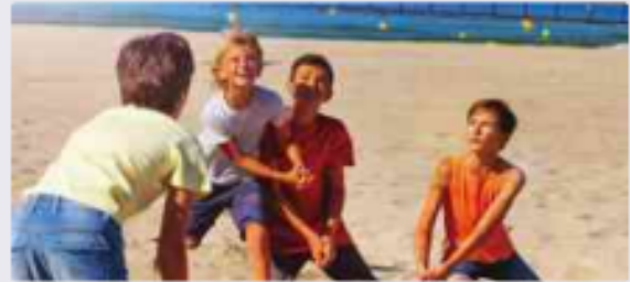
الفئة المجتمعية والعلاقات بين أفرادها: