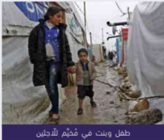
طفل وبنت في مخيم للاجئين

يعاني العديد من الأطفال اللاجئين أوضاعاً صعبةً في كلّ من الدّول حيث نزح هؤلاء الأطفال من بلادهم بسبب الأحداث المؤسفة وتركوا منازلهم ومدارسهم، وهم يحتاجون إلى دعم نفسيّ يخفّف عنهم ألامهم، كما يحتاجون إلى التعليم كي لا يخسروا مستقبلهم.