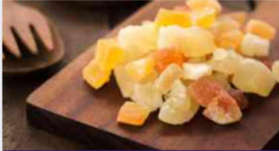
طبق من الفواكه المجففة المتنوعة

جميعنا متنوعون. لا يشبه أحدنا الآخر. في الواقع، لو كان جميع البشر متشابهين لكانت الحياة مملة. تخيّل ما كان ليحصل لو كان كل زملائك في الصفّ يشبهونك، ويحبّون نفس الأمور التي تحبّها أنت؛ لربّما أصبحت الحياة أبسط، لكن مملة للغاية. التنوُّع والاختلاف يثريان الحياة.