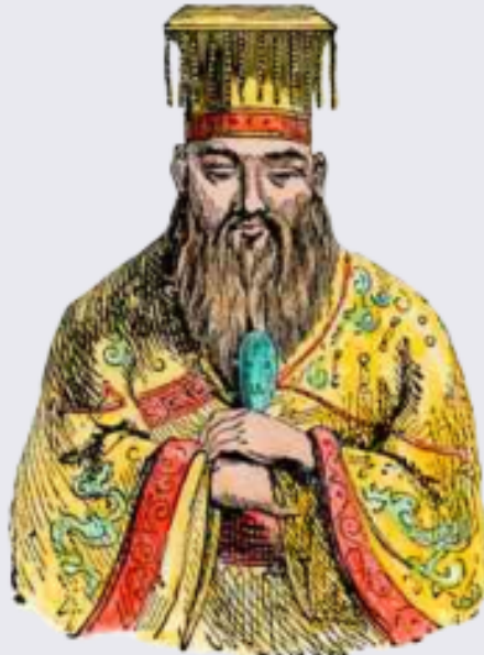
كونفوشيوس هو فيلسوف صينيّ اشتهر بأنه يتمسك بالعادات الصليّة الأخلاقيّة والاجتماعيّة

كونفوشيوس هو الاسم الشائع خارج الصين لفيلسوف الصين الكبير كونغ فو تسي. ولد كونفوشيوس عام 551 ق.م وتوفي عام 479 ق.م في دويلة لو (مقاطعة شاندونغ حالياً). في ذلك العصر سادت الفوضى وتهاوت القيم الأخلاقيّة في المجتمع. كان الهدف السياسيّ الأسمى لكونفوشيوس هو العودة بالمجتمع إلى ما كان عليه من نزاهة وأمانة وإعادة النظام الهرميّ للدرجات الاجتماعيّة. يبدو تأثير فكر كونفوشيوس في عمارة الصين واضحاً، من منازل العامّة إلى قصر الإمبراطور. فإنشاء منازل العامّة، التي تسمّى "سي خه يوان"، أي الدار المرثعة، يلتزم بالمبادئ والقواعد الكونفوشيوسية في التعامل والعلاقات، التي تضع فروقاً صارمةً بين الداخل والخارج، السامي والوضع، الذكر والأنثى.