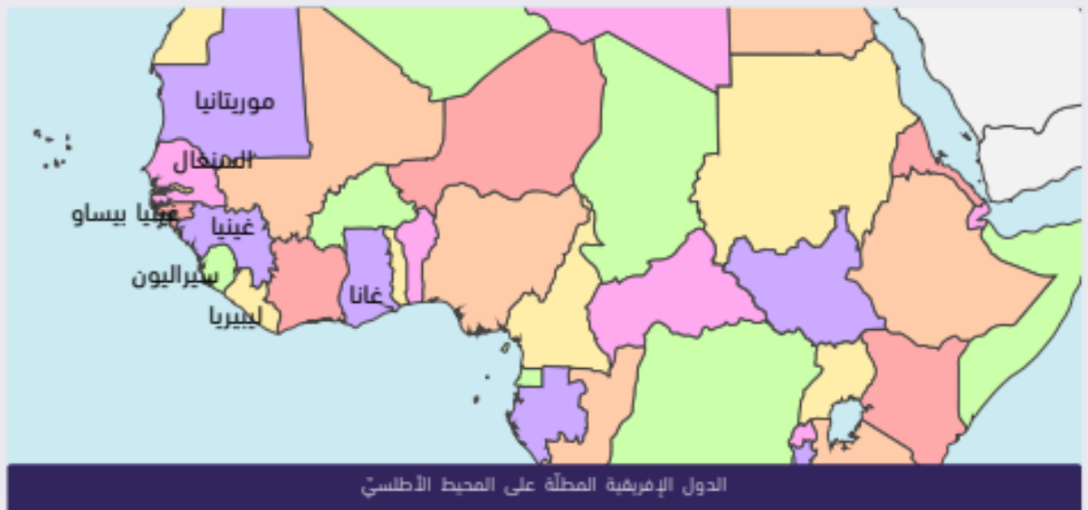
الدول الإفريقية المطلة على المحيط الأطلسي

أ. أجر بحثًا حول الحياة على الساحل الإماراتي ودولة إفريقية ساحلية مركّزًا على الصفات والممارسات والتحديات التي واجهت القاطنين على السواحل الإماراتية والأفريقية، وقارن بينهما.