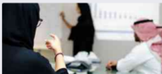
الفئة المجتمعية والعلاقات بين أفرادها:

ب. بناءً على ما اكتشفته في القسم الأول من النشاط عن الأنواع المختلفة للفئات الاجتماعية وطبيعة العلاقة التي تربط بين أفرادها، اكتب في الخانات أدناه أسماء بعض الفئات الاجتماعية التي تنتمي إليها وحدد نوع العلاقة بينك وبين كل منها، ثم اكتب اسم الفئة الاجتماعية الكبرى التي تتكون من هذه الفئات.