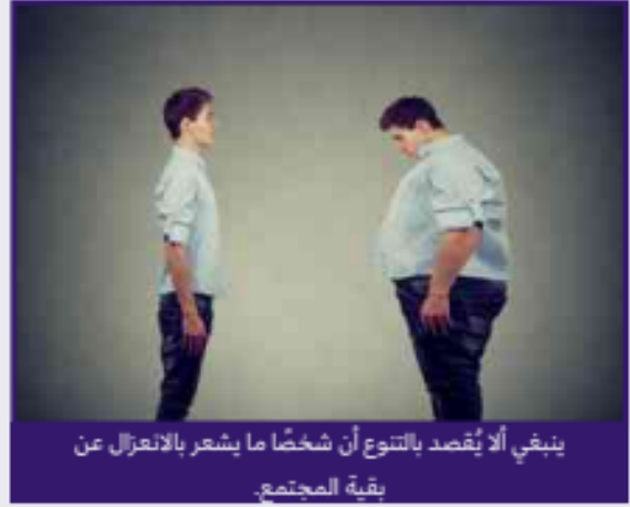
ينبغي ألا يُقصد بالتنوع أن شخصًا ما يشعر بالانعزال عن بقية المجتمع.

أ. تذكر موقفًا شعرت فيه أنك غريب. يَمّ جعلك ذلك تشعر؟ ما كان رأيك في الآخرين آنذاك؟