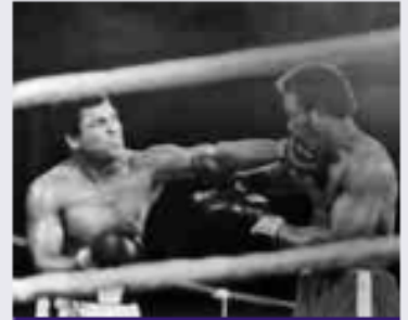
2. محمد علي