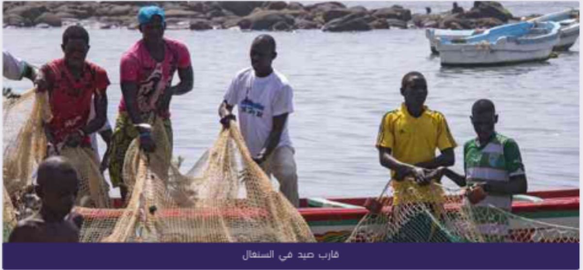
فارب صيد في السنغال

قال مدير قطاع التنمية المستدامة لمنطقة أفريقيا لدى البنك الدولي جمال الصغير: "في أفريقيا، تتيح مصائد الأسماك 10 ملايين فرصة عمل للسكان المحليين. ومع تحسّن نظم الإدارة يمكن لهذه المصائد أن تدرّ ملياري دولار أخرى على الأقلّ كل عام. وخلافًا للثروة المعدنيّة والموارد الأخرى غير المتجدّدة، يمكن أن يشكّل ذلك مساهمةً مستمرّةً في النموّ الاقتصاديّ في مختلف أنحاء المنطقة".