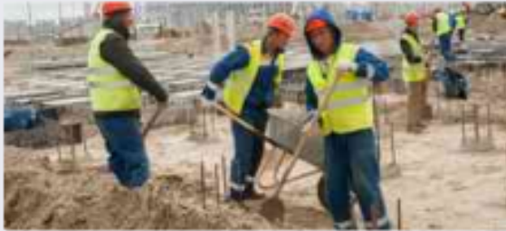
الفئة المجتمعية والعلاقات بين أفرادها: