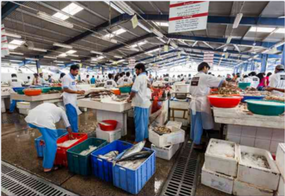
سوق السمك في دولة الإمارات العربية المتحدة

ويتابع الشامسي: «المهنة البحريّة قديمة ومتجذّرة في وجدان سكّان السواحل، يمارسونها بحبّ وإصرار عجيبين، ويقدر ما هي مهنة تحتاج إلى خبرة وجسارة، فإنّها تحتاج إلى صبر يتحلّى به الغوّاص أو الصيّد قبل أن يهّم هو ورفاقه برحلة الغوص أو الصيد، سعياً للبحث عن لقمة العيش غير مبالين بلفحة الشمس التي تلهب سمرة جباههم. ورحلة الغوص لدى أهالي دولة الإمارات تمثّل قصّة أزليّة ورحلة عشق مع عالم البحر وأساره ومكنوناته».