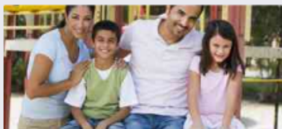
الفئة المجتمعية والعلاقات بين أفرادها: