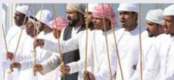
الفئة المجتمعية والعلاقات بين أفرادها: