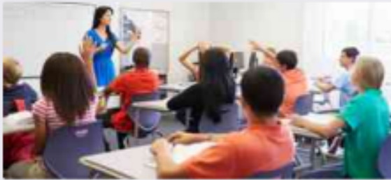
الفئة المجتمعية والعلاقات بين أفرادها: