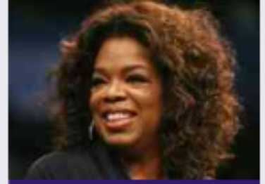
1. أوبرا وينفري