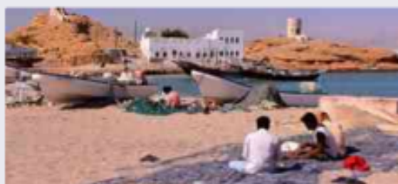
الفئة المجتمعية والعلاقات بين أفرادها: