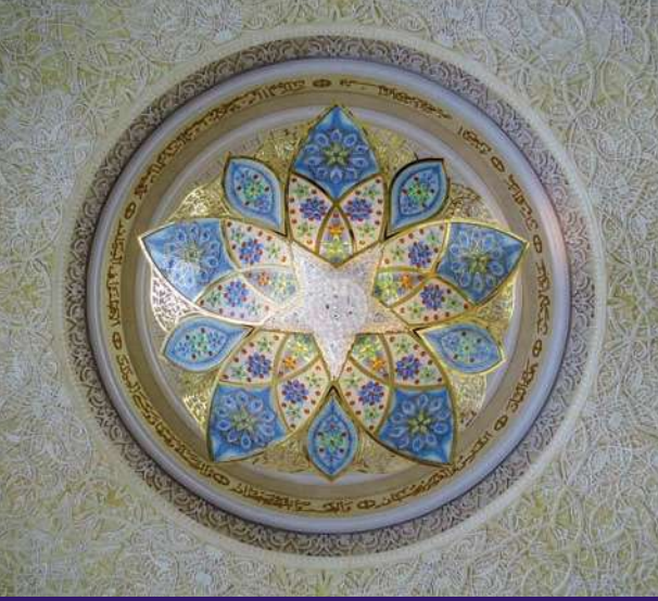
مستوحى من جامع الشيخ زايد الكبير، أبوظبي

تصميم يعكس مفاهيم الثقافة المحلية والمجتمع المعاصر والمواطنة العالمية.