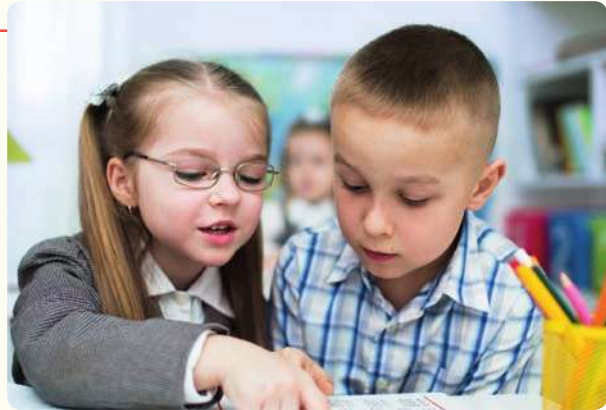
أتعاون مع زميلي

أطلب من زميلك مساعدتك في تنفيذ عملٍ صعبٍ عليك.