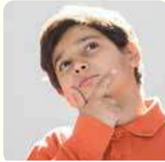
كَيْفَ أَظْهِرُ اهْتِمَامِي؟

فَكِّرْ أَيْضًا فِي عَوَاقِبِ هَذِهِ الْأَعْمَالِ. نَاقِشْ أَعْمَالَكَ مَعَ زَمِيلِكَ.