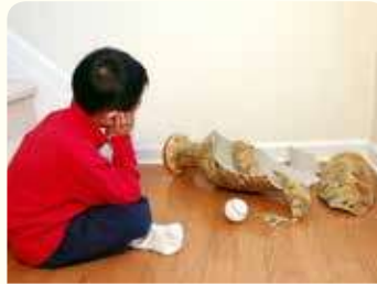
4. كسرت زهرية والدتك من دون قصد أثناء اللعب في المنزل.