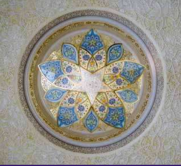
مستوحى من جامع الشيخ زايد الكبير، أبوظبي

تصميم يعكس مفاهيم الثقافة المحلية والمجتمع المعاصر والمواطنة العالمية.