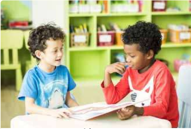
لم تكن حقا أنا!