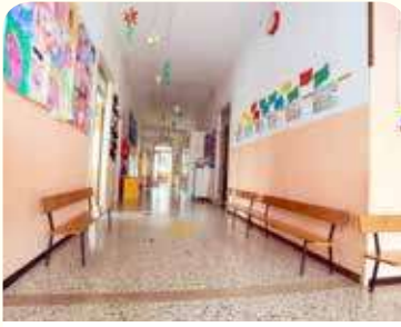
جولة حول المدرسة

فناء المدرسة. خان وقت الصيد! سيتأخذك المعلم في جولة حول المدرسة. لاحظ أي دليل على الاهتمام بالبيئة المدرسية.