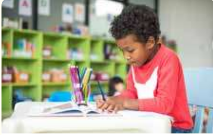
طالبٌ يرسمُ قِصَّةً

ازيّم صُورَةَ لِلْقِصَّةِ الَّتِي تُرِيدُ سَرَدَهَا عَنْ أَحَدِ جَوَائِبِ تُرَائِكَ. تَذَكَّرْ إِذْرَاحَ أَكْبَرَ قَدْرٍ مُمَكِّنٍ مِنَ التَّفَاصِيلِ لِأَنَّ ذَلِكَ سَيُسَاعِدُكَ عِنْدَ مُشَارَكَةِ الْقِصَّةِ مَعَ طَلَبَةِ الصَّفِّ.