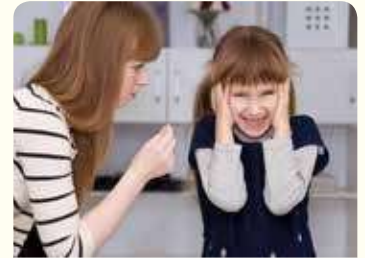
3. لا تصغي إلى نصائح الوالدين