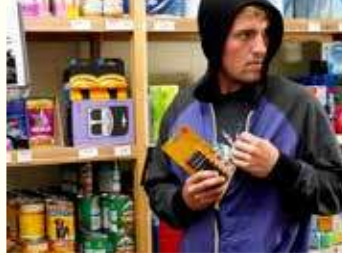
2. في المتجر، رأيت صديقًا يضع شيئًا في جيبه من دون دفع ثمنه.