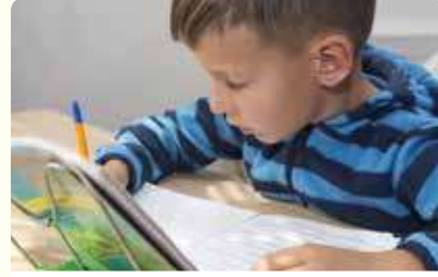
طالِبٌ يَكْتُبُ فِصْفَةً