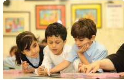
الإغتناء بالأصدقاء في المدرسة