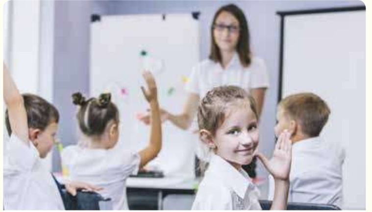
التعلّم من خلال سرد القصص

نَحْنُ الآنَ عَلَى عِلْمٍ بِكُلِّ شَيْءٍ حَوْلَ الْقِصَصِ وَسَرِدِهَا. هَلْ تَتَذَكَّرُ الْغَرَضَ مِنَ الْقِصَصِ؟ وَمَا الْأُمُورُ يُمَكِّنُهَا أَنْ تُعَلِّمَنَا إِيَّاهَا؟