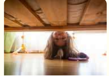
1. افتترضت لعبة صديقك وأضعتها.