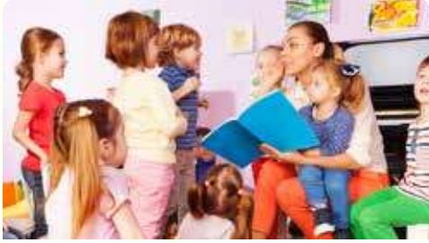
حان وقت القصة

3 هُناك أنواع كثيرة مُختلفة من القصص. كم نوعًا مُختلفًا منها يُمكنك تسميته؟ هل يُمكنك إعطاء بعض الأمثلة للأنواع المُختلفة من القصص؟